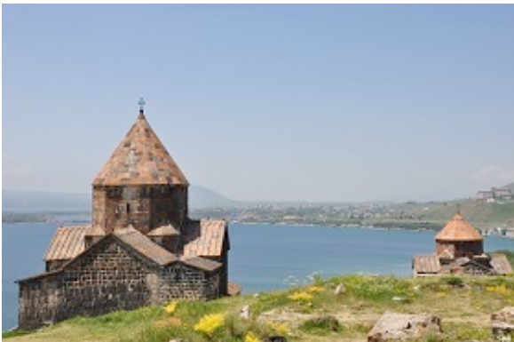
Monastero di Sevanavank

La giornata è splendida un cielo terso ci accompagna fino a Sevanavank , la strada è ricca di scorci panoramici, il paesaggio ridente ; i colori vividi e l'aria tersa ci confermano che viaggiamo in un altipiano a 2000 metri di altezza. Per mezzogiorno siamo a Sevanavank, pranziamo nel parcheggio sotto al bel Monastero situato in cima al colle che sovrasta il lago dalle splendide tonalità smeraldo e turchese (N 40.56586 E 45.00550). La lunga rampa di gradini che porta al Monastero è occupata da pittori che espongono le loro opere.