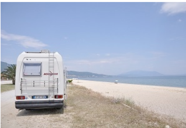
Sosta ad Asprovalta

Abbiamo tutto il tempo per un pisolino, un temporale serale rinfresca l'aria, la notte trascorre tranquilla, dormiamo cullati dal mormorio delle onde a pochi metri da noi .