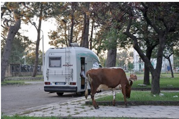
Posto di polizia di Gonio (sosta notte)

La prima visita in Georgia è al castello di Gonio, visitiamo l'esterno, scattiamo alcune foto, ma prima di partire scorgo nel bel parco oltre la strada, una caserma della Polizia. Entro e chiedo ai poliziotti se è possibile sostare per la notte.