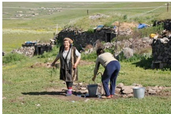
Un rustico villaggio