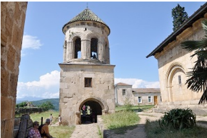
Monastero di Gelati

Il figlio del panettiere parla bene inglese ; approfittiamo per chiedere informazioni per i Monasteri , egli aspetta che pranziamo per poi accompagnarci a Mutsamet , e durante il tragitto riesce anche a trovare un bancomat dove saldare la multa fatta dai gendarmi ( l'importo è di 10 euro , poca cosa , ma è stata la loro arroganza che ha suscitato rabbia ) .