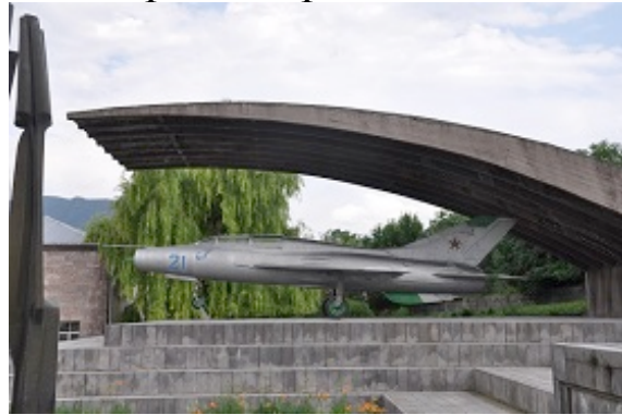
Il Mig 29

di Sanahin. L'aereo è stato la bestia nera per l'aeronautica statunitense, e ancora oggi le sue forme stupiscono per razionalità e bellezza.