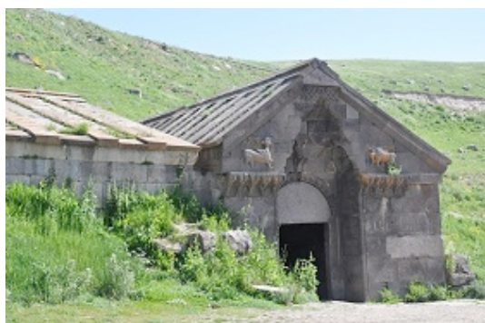
Caravanserraglio di Selim Pascià

Eccoci a Selim Pascià ; sostiamo davanti al Caravanserraglio e veniamo invitati da un gruppo di uomini e donne provenienti da Yerevan a fare colazione e brindare con loro. Entriamo nel loro gruppo, ben presto si crea una bellissima intesa. Partecipiamo divertiti alla loro allegria; è un incontro piacevole, scambiamo gli indirizzi e ci congediamo a malincuore. Inizia la discesa verso Noravank, tra paesaggi mozzafiato , sino ad imboccare una gola scavata tra rocce rosse, splendenti al sole. La strada è deserta il paesaggio affascinante, aspro e ridente allo stesso tempo, un'emozione indimenticabile.