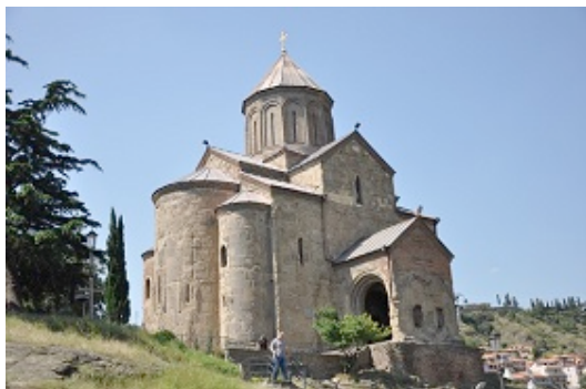
Chiesa di Metekhi (Tblisi)

Al ritorno a Mtskheta assistiamo ancora a una gimkana di altri studenti ( si vede che per loro è un rito!) ammirati da ragazze in abiti succinti e zeppe altissime tanto che alcune per camminare devono sostenersi a vicenda. Quando lo spettacolo è al top arriva la Polizia che dispensa multe a tutti! Facciamo un giro nel centro storico, compriamo dei salamini dolci, ripieni di nocciole, poi a letto, fa caldo ma dormiamo bene.