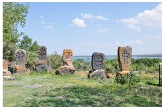
Katchkar a Hayravank