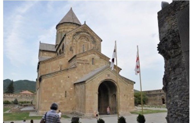
Cattedrale di Svetitskhoveli

18-06-14 Sosta a Mtskheta e visita a Tblisi