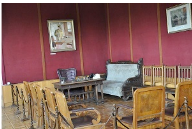
Studio di Stalin (Gori)

Dopo cena invitiamo nel camper il titolare a bere un caffè, quando capisce che siamo italiani, ritelefona alla figlia, e con un misto di italiano e spagnolo finalmente riusciamo a capirci e simpatizzare. Siamo meravigliati per la genuina ospitalità di queste persone.