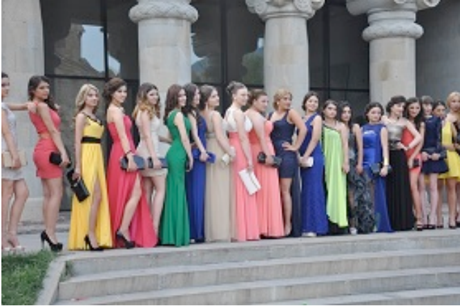
Studentesse in festa a Mtskheta