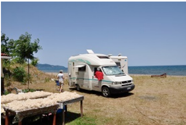
Camping a Ordu (tavoli con lana ad asciugare)

26-06-14 Sosta a Ordu. Ci concediamo una giornata di relax; bel tempo.