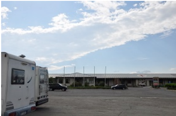
Sosta all'Ospedale Camilliano