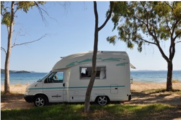
Sosta a Igoumenitsa

Verso sera arrivano dei poliziotti che ci chiedono quanti giorni abbiamo intenzione di sostare, ma non ci contestano la sosta, anzi sono molto gentili (abbiamo capito che la sosta è tollerata ma senza verande né tavolini).