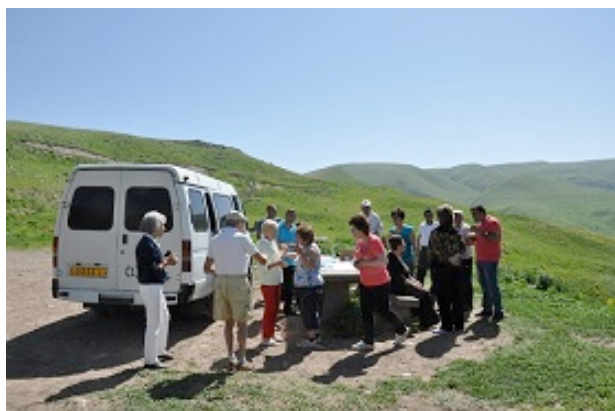
Un piacevole incontro a Selim

A mezzogiorno sostiamo per il pranzo sotto al Monastero di Noravank, capolavoro dell'architettura Armena, lo visitiamo prima di pranzare. Fa caldo ma si sta bene, siamo sempre a 1900 metri.