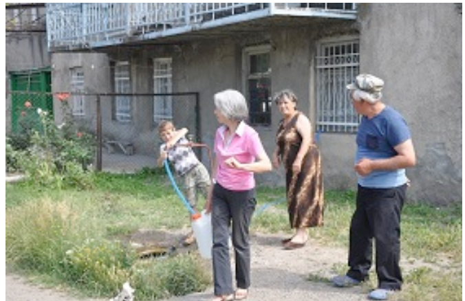
Rifornimento di acqua