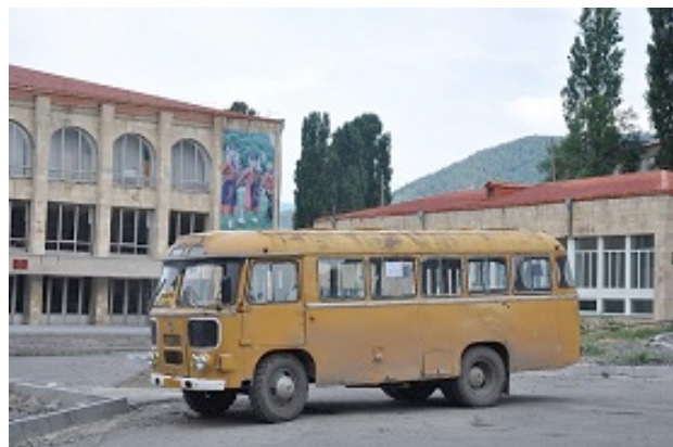
Un Autobus locale

che dorme in un carrozzone vicino a noi.